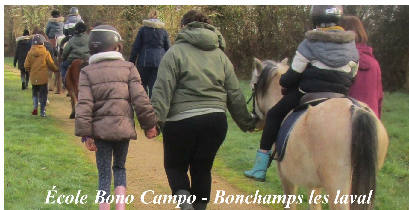
École Bono Campo - Bonchamps les laval

Ont participé: l'école Bono Campo de Bonchamps à La Grande Lande (12 élèves), l'école La Senelle de Laval à La Grande Lande (11 élèves), l'école Saint-Joseph de Craon (10 élèves), l'école Paul Éluard de Mayenne à l'écurie de Fiona (11 élèves), l'école Alain de Laval à La Grande Lande (12 élèves).