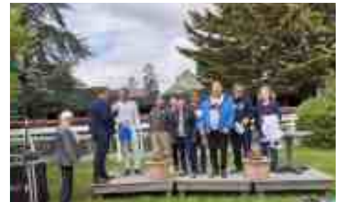
Senonnes-Pouancé 7 mai