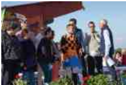
Méral 14 mai