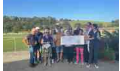
Nuillé-sur-Vicoin 8 octobre