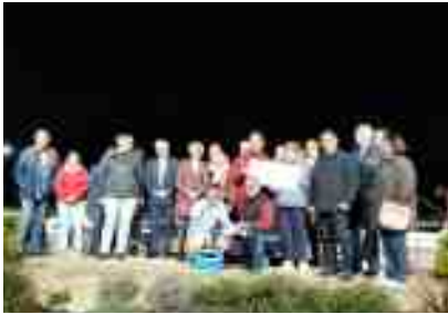
Laval 21 avril

Au-delà du soutien financier que représentent ces cinq événements, nos bénévoles bénéficient d'un accueil privilégié et chaleureux.