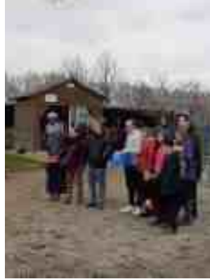
Meslay-du-Maine 12 mars